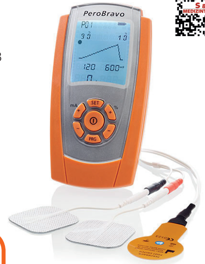
Fußschalter für das Gehtraining